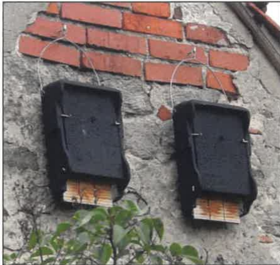
Gîte plat Schwegler modèle 1FF

Coût estimé de l'installation de gîtes à chiroptères : environ 2 000 Euros HT.